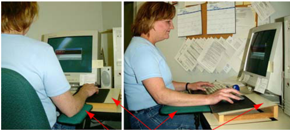
Appui-bras Plate-forme pour souris